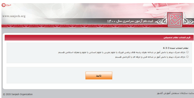
(تصویر شماره دو)

➤ آن دسته از متقاضیان نظام آموزشی جدید ۳-۳-۶ که (مطابق تصویر شماره ۲) بند مربوط به «دانش آموز شاخه نظری رشته های ریاضی فیزیک، علوم تجربی، علوم انسانی و علوم معارف اسلامی هستم» را علامتگذاری می نمایند وارد محیط دریافت کد سوابق تحصیلی و مشاهده مشخصات شناسنامه ای می شوند که پس از مشاهده و تأیید اطلاعات، این متقاضیان وارد صفحه بارگذاری عکس (تصویر شماره ۴) شده و پس از بارگذاری و تأیید عکس وارد محیط تقاضانامه ثبت نام می شوند.