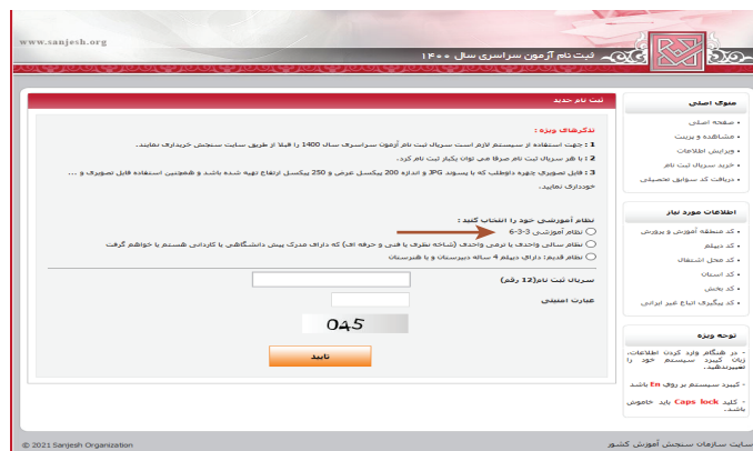
(تصویر شماره یک)

➤ متقاضیانی که نظام آموزشی جدید ۳-۳-۶ را در تصویر یک به شرح زیر انتخاب می نمایند وارد محیط فرم انتخاب نظام تحصیلی (تصویر شماره ۲) به شرح زیر می شوند.