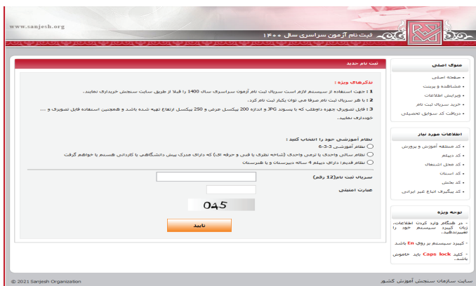
(تصویر شماره یک)

متقاضیان با ورود به صفحه «ثبت نام جدید» (تصویر شماره یک) می توانند نظام تحصیلی خود را با یکی از حالت های زیر انتخاب نموده و با درج سرریال ۱۲ رقمی ثبت نام، وارد فرایند روند ثبت نام شوند.