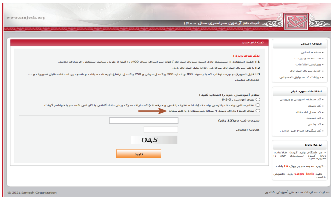
(تصویر شماره یک)

این متقاضیان بعد از بارگیری عکس و تأیید، وارد محیط تقاضانامه شده و لازم است نسبت به تکمیل بندهای تقاضانامه ثبت نام اقدام نمایند.