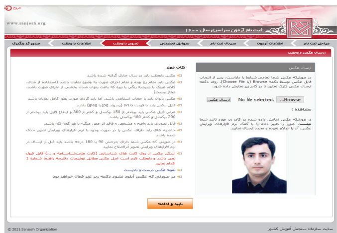
(تصویر شماره چهار)

همه متقاضیان حالت‌های اول تا سوم پس از تکمیل تقاضانامه ثبت نام لازم است نسبت به پرینت تقاضانامه تکمیل شده که حاوی اطلاعات متقاضی و همچنین شماره پرونده ۷ رقمی و کد پیگیری ثبت نام ۱۶ رقمی می باشد اقدام نمایند.